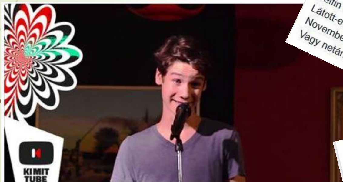
FINÁLÉ - Beni - Szlemtől szembe - Zene - Ki Mit Tube 2015 - Ki Mit Tube 2015